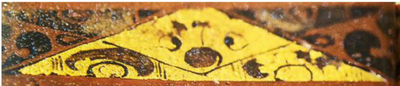
图3 金片漆盒的天象纹饰

载的可能是日食的过程，虽属猜测，但与天象有很大的关系，也契合汉代时期人们对仙境生活的向往以及永生的期望。（图3）