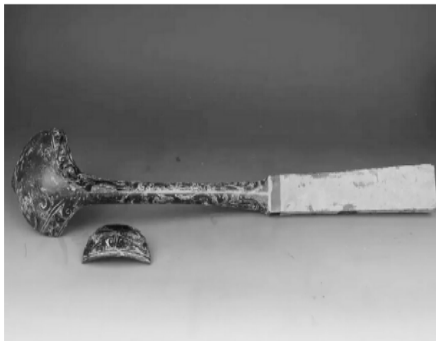
图2 云气纹漆勺

南昌海昏侯墓出土漆器从出土的器物可见我国汉代的漆器自然景观的取材绝大多数来源于现实中的自然景象，云气纹、卷云纹、波纹、山峰形纹、火纹等属于主要纹样。流畅均匀、蜿蜒舒卷的线条翻转而组成的对称的图案便属于卷云纹，变化层次丰富，给人以美的感受。海昏侯墓出土的云气纹漆勺以及汉代漆器纹饰的组合符合文学的随心所欲、空虚缥缈的特点。在漆器上表现的云气纹线条流畅，图案设计所采用的色彩以及形式自如流畅可谓是精品之作。（图2）