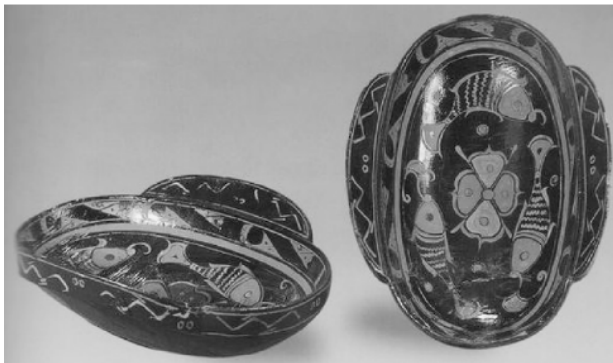
图4 三鱼纹漆耳杯

从漆器外形可以看出当时的设计以简朴作为主流，同时也将漆器的高品质更加凸显出来。我们也不难看出有一种天然的大美，思想内涵丰富，而且尺度和型制符合现代的审美。（图4）主要表现的是仿生设计，顺物于自然，遵循自然的生态美。南昌海昏侯墓出土的漆器是我国传统手工艺的杰作，将纹饰图案巧妙地运用在漆器的设计之中，恰到好处地将设计灵魂表达出来。自然生物、天象纹样的表达，有着西方“少即是多”的韵味，表现出大富、大吉、尚高，并且突出了设计的两个核心点，即尺度和型制，并采用仿生设计。漆器作为文化的承载，真实地反映汉代社会生活与文化，在生活层面上，讲究饮食文化，文化层面上信奉神话传说等。